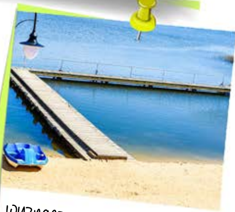
wyznaczone miejsce do kąpieli

domowa i smaczna kuchnia zróżnicowane i bogate menu możliwość dostosowania diety do potrzeb zdrowotnych najwyższej jakości składniki od regionalnych producentów