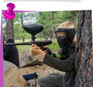
paintball kids & adult