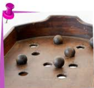
old wood games