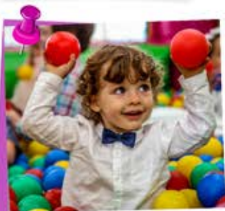
basen z kulkami