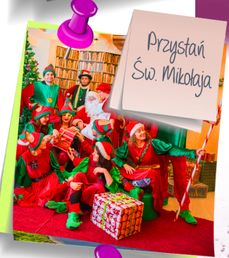
Przystan Św. Mikołaja